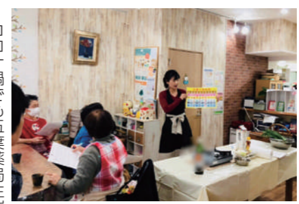
コロナ前に開催していた薬膳料理教室

健康教室では漢方的な視点を取り入れて「病気になるための体づくり」を意識してお話していました。今はコロナで開催できないうので YouTube チャンネル「たづこ先生の漢方教室」を開催してこちらでお話しています。