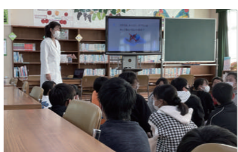
小学校での講演活動

もともとこの体操教室は地域のフレイル予防のために始めましたから、参加の方がフレイルになってしまったら元も子もありませんからね。