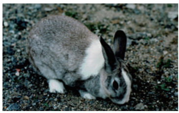
↑飼っていたウサギのクッキー。

「これまで何を飼ってきたの?」という質問をよくいた だきます。そこで今回は、私の思い出の動物の話させて ください。幼少期は、虫や魚、カエル、トカゲ、身近な野 生の生きものに関心があつて観察する毎日。観察の延長に、 飼育という行為があつたように思います。よりじっくり観 察するために捕まえて、手元に置くという感じです。 そんな私が初めて長期飼育した哺乳類が、ウサギです。 捕まえてきたわけではありません(笑)。小学生のころ、 飼育委員会に所属していて、ウサギとニワトリの世話をし ていました。今だから告白しますが、「ウサギはすぐ殖え るから、オスと一緒にしたらあかんぞ」と先生に言わ れていたら、知らず知らずのうちに飼育してしまっ たのです。先生、本当にごめんなさい。案の定、しばらく して仔ウサギが産まれました。それを1羽(ウサギは1羽 2羽と数える)もらつて帰つたのです。 クッキーと名付けたメスウサギは観察していて飽きませ んでした。一番興味深かったのは食糞。ウサギのウンコは コロコロですが、実はあれは2回目のウンコ。1回目のウ ンコはペースト状で、またぐらに頭を突っ込んで肛門から 直接食べべします。これを食べないと栄養が摂取でき ず、体調を崩します。 他にも散歩のとき、ネコが現れると、耳を立て、後ろ脚 を地面にダン!とたたきつけるスタンピングで私に危険を 知らせてくれたり、偽妊娠(想像 妊娠)をしたりと本当に興味深い 動物でした。そんなクッキーで すが、私が大学生になるまで生きた 自分には驚いたものです。動物と の絆を覚えてくれたのもウサギ だったのかも知れません。