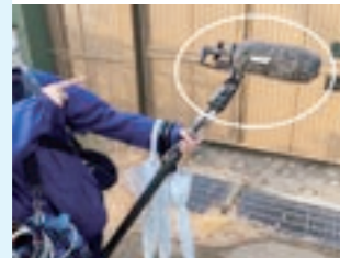
↑テレビスタッフが使う大型マイクにもウインドジャマー(白丸)。

鳥の耳はなぜ? こんにちは！うちにいるたくさん動物たち。最近、そこに鳥たちも仲間入りしました！というわけで、今日は鳥の話。 よく聞かれる、「鳥の耳はどこにあるの？」問題。ときに騒音被害もたらすほどおしやべりな鳥たち。もちろん、耳はあります。しかし、外見からはわかりません。羽毛に覆われているからです。うちのオカメインコの羽毛をどかしてみたら？画像のように、ちょうど目のうしろあたりに穴が空いています。これが耳なのです。多くの動物のような、つぶった耳ではなく、穴だけ。凶暴などでハゲタカを見れば穴しかないのがよく分かります。どっぱった耳だと空気抵抗が大きくなるので、飛行の邪魔になると考えられています。 ではなぜ、多くの鳥類の耳は羽毛に覆われているのでしょうか？「聴こえにくくないか？」と思う方もいるかもしれませんが、逆なのです。ウインドジャマー(風防)と同じ効果があるのは向られている大型マイクはフサフサしています。これがウインドジャマーです。これがあることで、ボーボーといった風切り音や吐息の雑音が入らないのです。鳥は速い速度で飛びますし、風にもさらされます。そんなときでも雑音が入らないようにしているのです。自然は本当に良くできています。 鳥類ほか動物を用いた教室のご依頼ご相談はお気軽に！お問い合わせください！