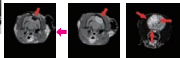
↑「脳腫瘍摘出後」 ↑「脳腫瘍手術前」 ↑「脳炎のMRI」

術や膝蓋骨脱臼(パテラ)の手術、前十字靭帯断裂の手術(PLD)を行っています。プレートは基本的に体との相性が良いチタンプレートを使用しています。心疾患の診断治療は、循環器専門の先生を関東からお呼びして、集中的に診察しています。私が循環器を診察する際は、その先生と連携をとって内服の調整をしています。