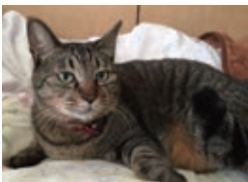
↑当院の看板猫 (東日本大震災の被災猫)

術や膝蓋骨脱臼(パテラ)の手術、前十字靭帯断裂の手術(PLD)を行っています。プレートは基本的に体との相性が良いチタンプレートを使用しています。心疾患の診断治療は、循環器専門の先生を関東からお呼びして、集中的に診察しています。私が循環器を診察する際は、その先生と連携をとって内服の調整をしています。