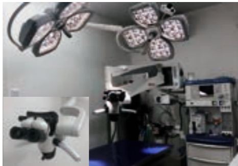
↑「手術用顕微鏡」 ↑「手術室」