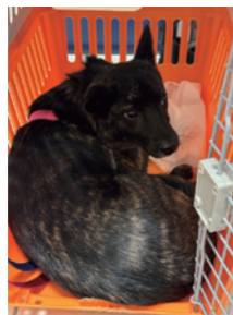
↑甲斐犬の血が入ってそうなる虎毛のちよむすけ。

右のQRコードは、大洲のインスタグラムなどへのリンク集です。ぜひフォローください！