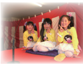
第一回、第二回はレ・アール特設会場にて開催。