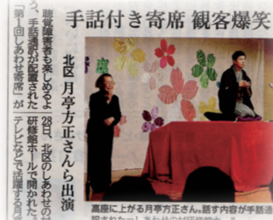
三回目やしあわせの村にて300人限定で開催しました。手話の先生に参加して頂き、聴覚に障がいのある方にも楽しんで頂けるようにしました。