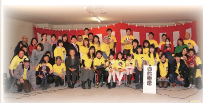
第一回西鈴寄席 レ・アール特設会場（関西スーパーの入るビル2階）寄席会場を手作りで作成。150席満員でした。

平成27年 第一回西鈴寄席 平成28年 第二回西鈴寄席 平成30年 第一回しあわせ寄席